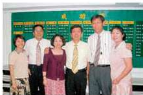
▲ 在台灣推展人的協助下，事業發展更順利。