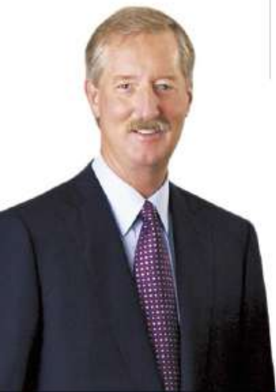
Steve Van der Meer 安麗公司 董事長 史提夫·溫安洛

此外，這種承諾不僅是所有安麗直銷商的特質，同時也使身為安麗直銷商的你，有別於那些冷眼旁觀和視而不見的第二、三類人。因為建立安麗事業的承諾是經過深思熟慮之後的抉擇，並非只是一個你必須做的決定，而是一個由你決定，主動讓夢想成真的承諾。