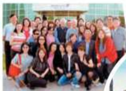
▲帶領導人參觀紐西蘭農場。