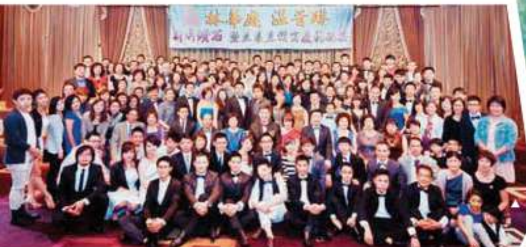
▲ 團隊夥伴為他們舉辦鑽石慶功宴，並對他們的傑出成就感到驕傲。