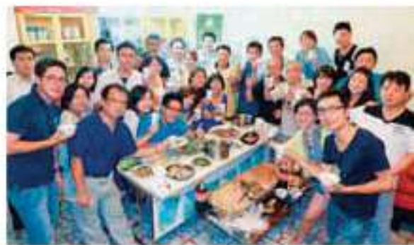
▲夥伴們一路上的支持，是他們成功的致勝關鍵！