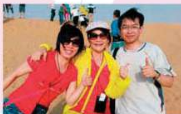
▲ 與恩師在杜拜齊慶沙。