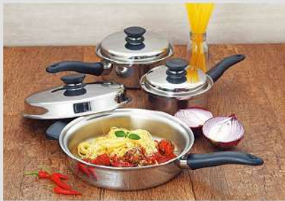
原味複合金鍋6件組及 食尚生活特惠活動 1月14日登場