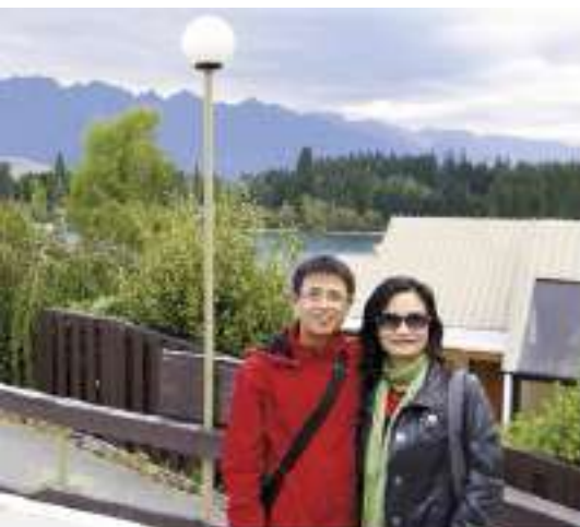
◀▲ 安麗帶他們環遊世界·享受人生。