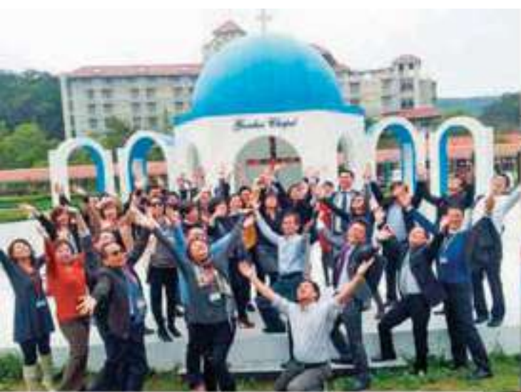
▲ 讓上帝聽到我們的夢想。