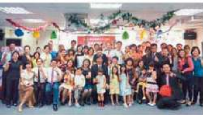
▲擔任團隊的訓練中心執行長。