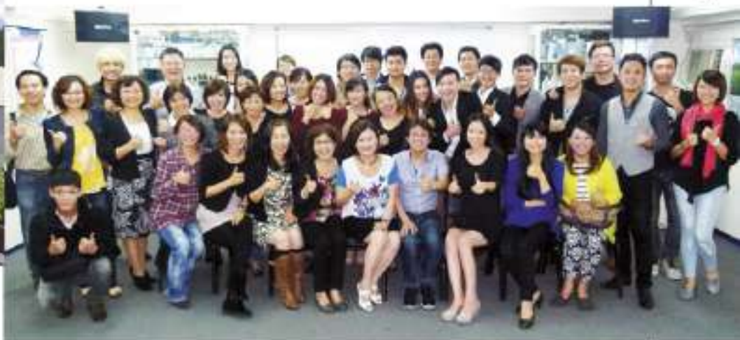
▲ 團隊共同朝更高目標邁進。