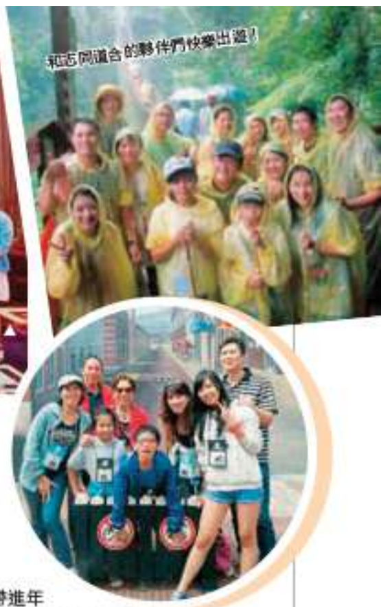
全家人一起出席日韓遊輪之旅，共創美好回憶！