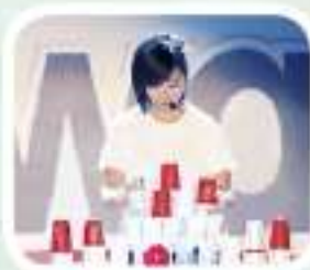
▲世界盃冠軍林孟欣

兩天的豐富活動，為所有與會人士注入充滿追求夢想的動力，同時也彼此勉勵成為有能力給予的人，與更多人一起邁向更美好的未來。