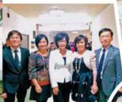
▲ 與指導成功方向的教練合影。