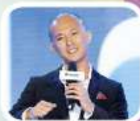
▲香港執行專才鑽石謝恩