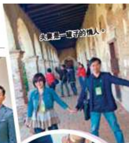
夫妻是一輩子的情人。