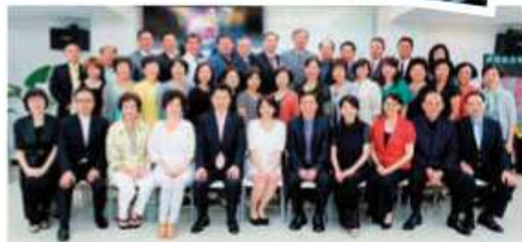
▲ 與團隊的鑽石級以上領導人合影。