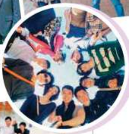
手拉手互相扶持直到目標到手。▼▼