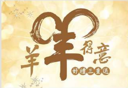
羊年得意好禮三重送 1月3日登場