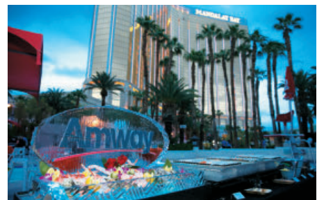
各項慶祝活動於曼德勒灣酒店盛大舉行