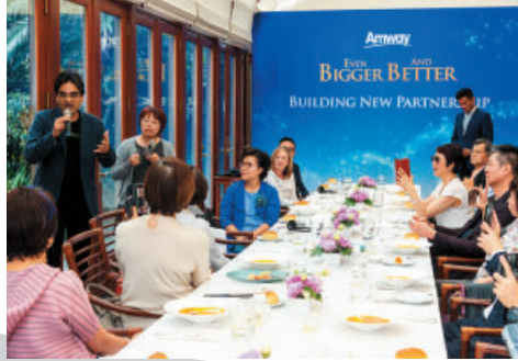
和領導人對談，彼此受益良多。