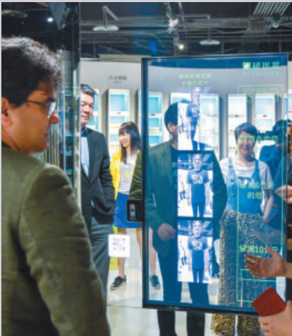
體態模擬果然能「預」見更好的自己。