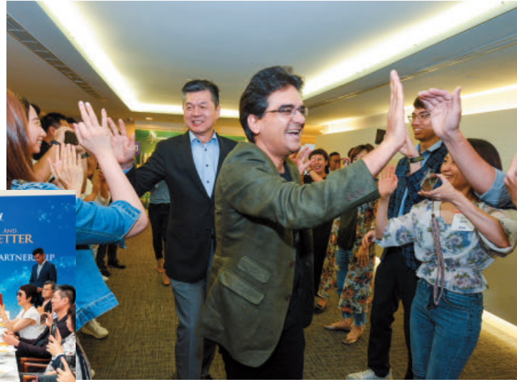
夥伴們滿滿的熱情和能量讓人印象深刻！

除了聆聽公司夥伴、資深領導人及新世代創客們的聲音，彼此也一同暢談未來發展，分享了所見所聞。