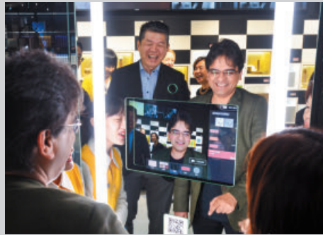
彩妝模擬讓人帥的不要不要。