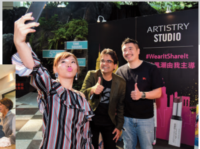
不管自拍還是合照，全都來者不拒。