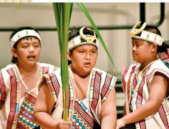
南投縣信義鄉新鄉國民小學「希那巴瀾——喜愛唱歌的布農孩子」

2017年「追夢計畫」經過專業的審查以及網路投票，選出了5組追夢得主。這些孩子有的熱愛音樂、有的熱衷科學或藝術，讓我們成為這些孩子的翅膀，陪伴他們的夢想起飛吧！