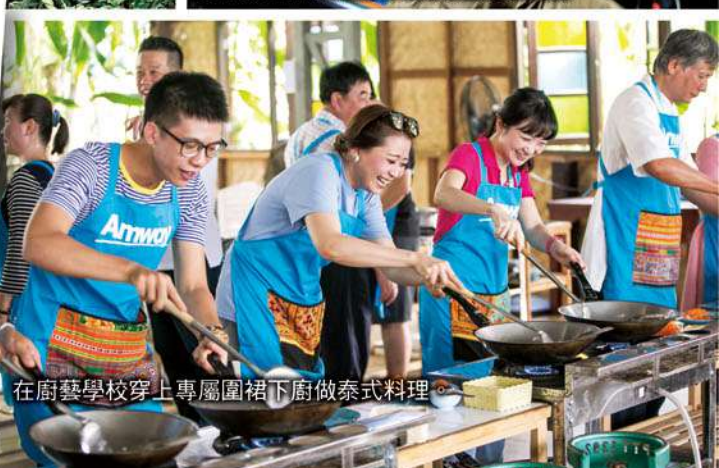
在廚藝學校穿上專屬圍裙下廚做泰式料理。