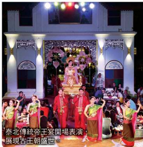
泰北傳統帝王宴開場表演，展現古王朝盛世。