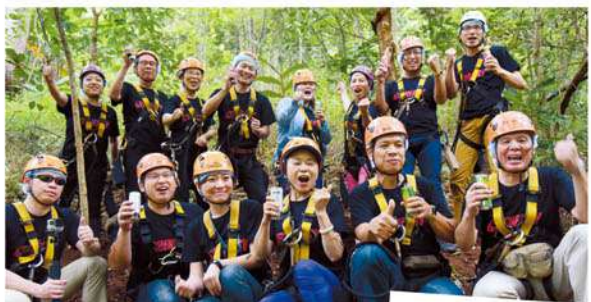
喝下XS，活力爆發挑戰叢林飛索。