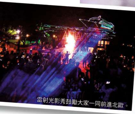
雷射光影秀鼓勵大家一同前進北歐。