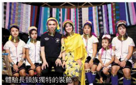
體驗長頸族獨特的裝飾。