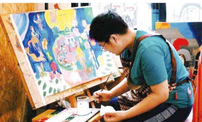
彩虹巴克斯「我們在這裡」身心障礙（自閉症）融合藝術展

一般社會大眾對身心障礙者並不瞭解，特別是「輕度自閉症」患者，他們沒有嚴重的症狀，外表與常人無異，但從小容易被同學老師視為不合群或壞脾氣的孩子，而被貼上「與眾不同」的標籤。然而他們往往潛藏令人驚豔的藝術天賦。「彩虹巴克斯」集結了一群擁有音樂與繪畫天賦的自閉症孩子，他們的作品有著強烈的風格，希望藉由「我們在這裡」彩虹巴克斯身心障礙（自閉症）融合藝術展，以特色主題展演、親子互動，讓更多人看見他們的才華！