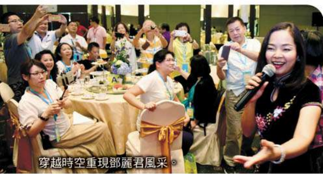
穿越時空重現邵麗君風采。