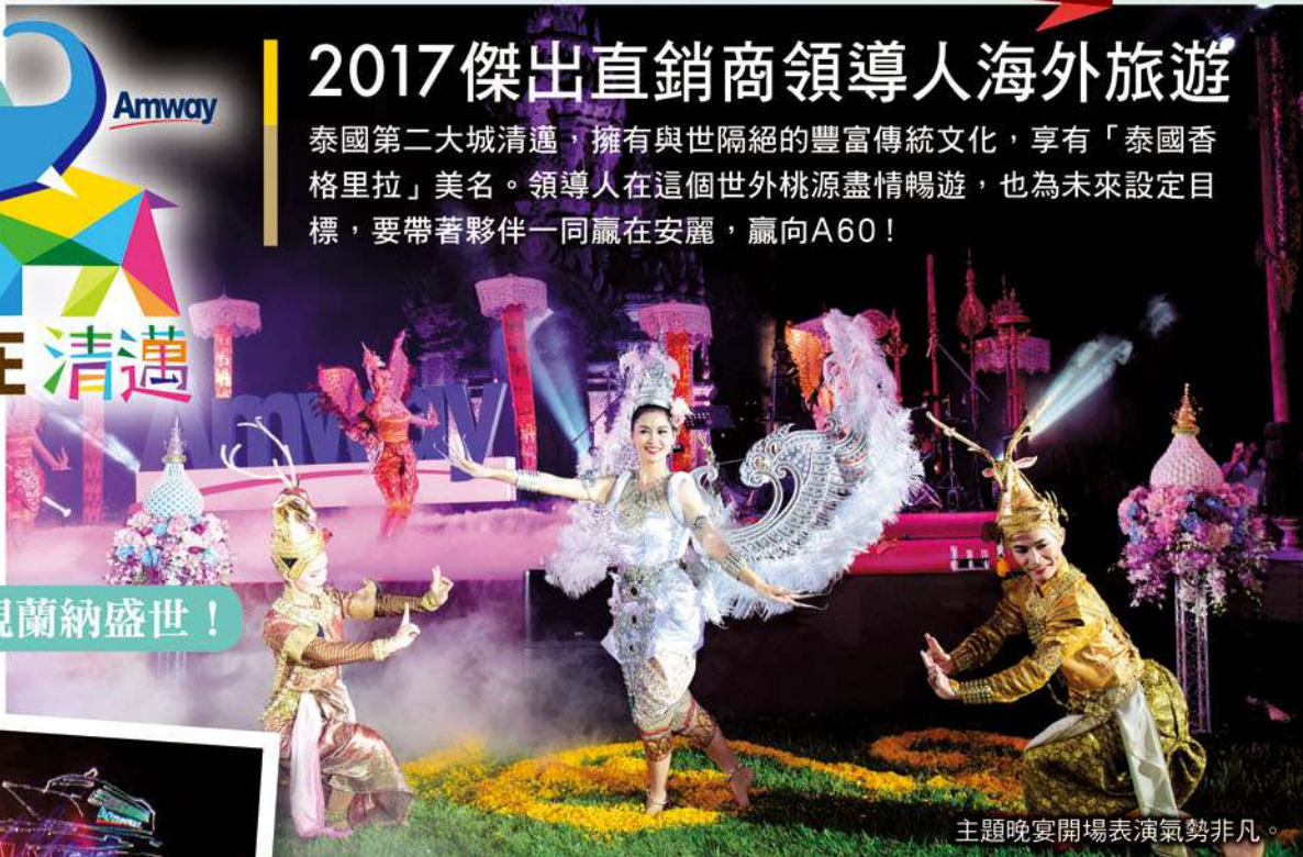
主題晚宴開場表演氣勢非凡。