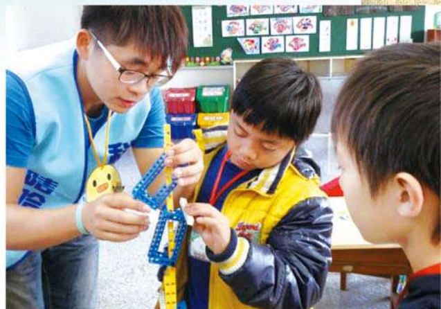
彰化二林工商「就決定是你了！哇哈哈科學服務團」

二林鎮位於彰化西南角，超過半數的國小學童來自低收入、單親、外配、隔代教養等弱勢家庭，這些孩子很容易自我否定，也因為成績不好，找不到自我價值。因此彰化二林工商學生組成「哇哈哈科學服務團」，將專業課程轉化為適合孩子發揮科學創造力的課程，幫助二林鎮四所國小的孩子們，透過每周兩小時的機器人程式設計社團教學，讓孩子在實作中體驗科學，培養創意發明、自主學習及團隊合作的技能；每年寒暑假還舉辦「科學創造力」營隊，讓偏鄉的孩子透過科學找到自己的價值，重拾自信！