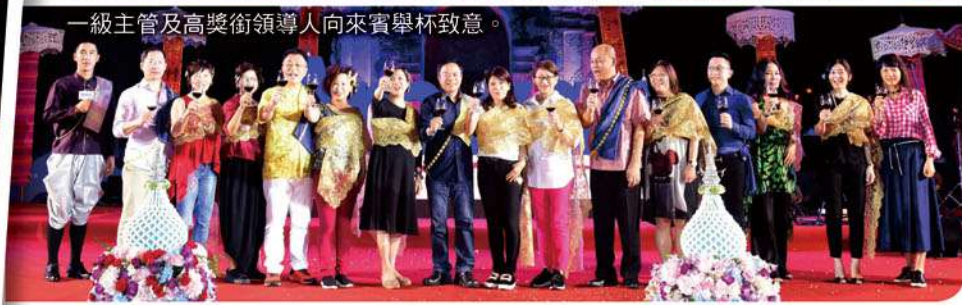
一級主管及高獎銜領導人向來賓舉杯致意。