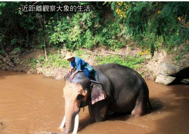
近距離觀察大象的生活。