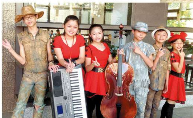
折翼天使樂團「折翼天使自我挑戰成長最後一哩路」

孩子們覺得自己是身心障礙者，懷疑怎麼學得一技之長？尤其聽障的孩子看著別人學習音樂，總是懷著羨慕又失落的心情。「折翼天使樂團」正是希望協助身障孩子感受音樂的美好。這群孩子從零開始，一步一步學習，挑戰自我身體的極限，透過一場一場的公演，克服上台恐懼，接下來希望能跨出更大一步，不僅在國內考取街頭藝人證照，更期盼到國外參與國際藝術文化交流，完成自我挑戰成長最後一哩路的夢想——自立謀生，不成為家人、社會的負擔。