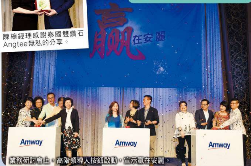
業務研討會上，高階領導人按鈕啟動，宣示贏在安麗。