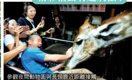
參觀夜間動物園與長頸鹿近距離接觸。