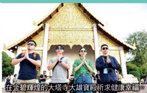
在金碧輝煌的大塔寺大雄寶殿祈求健康幸福。