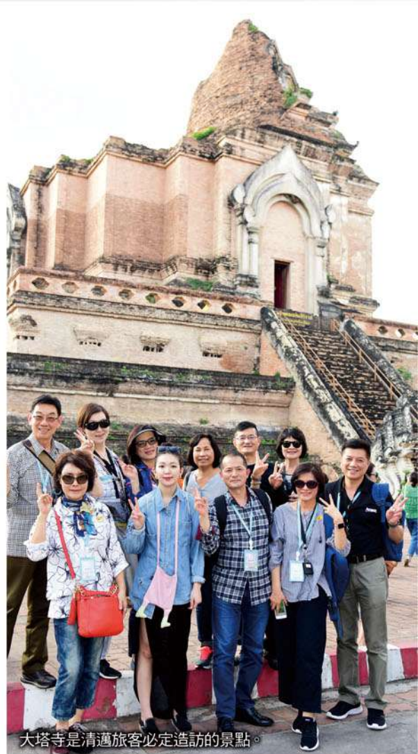
大塔寺是清邁旅客必定造訪的景點。