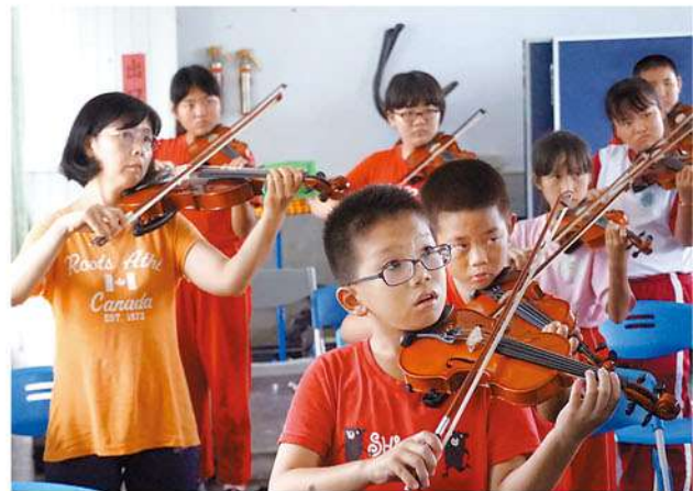
屏東縣新南國小「新南希望弦樂團——把希望變成弦」

屏東縣新南國小全校65位孩子，許多在吸毒、家暴、失親的家庭中成長，有些孩子患有學習障礙、亞斯伯格等疾病。曾任北市交響樂團提琴手的劉哲儒牧師看到孩子的需要與貧乏，向美國華僑募資，為每個孩子量身訂製了小提琴，更風雨無阻無償教導孩子拉琴。從完全沒有音樂基礎，到能拉出一手好琴，讓這群生活在社會邊緣的孩子，看到希望的曙光。然而，在他們小小的心中，始終沒有忘記曾經出資替他們買琴的美國華僑們。為了表達感謝之意，他們希望可以到美國，透過琴聲向這群華僑說聲：「謝謝你們，圓了我們的音樂夢！」