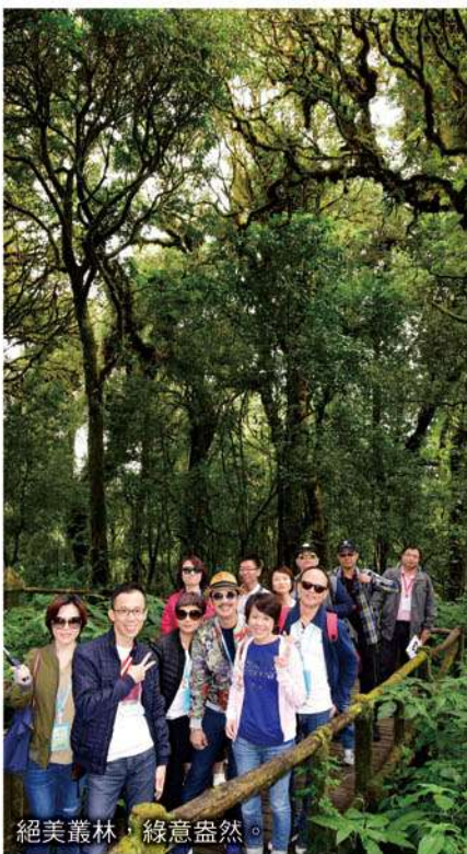
絕美叢林，綠意盎然。